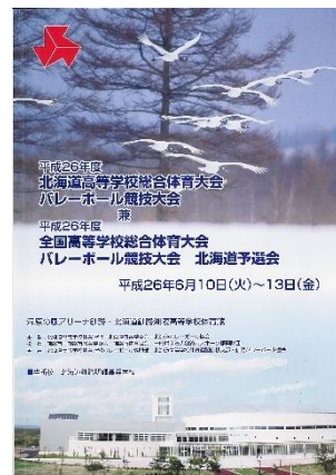
高体連釧路大会プログラム