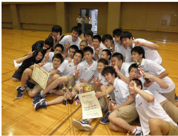
優勝した女子札幌大谷高校